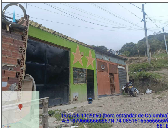
VISTA LATERAL IZQUIERDA CONSTRUCCIÓN ILEGAL