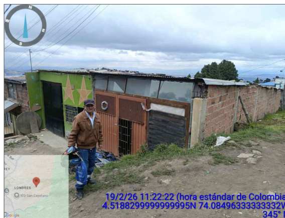
VISTA LATERAL DERECHA CONSTRUCCIÓN ILEGAL