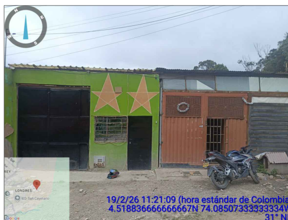
FACHADA PRINCIPAL CONSTRUCCIÓN ILEGAL